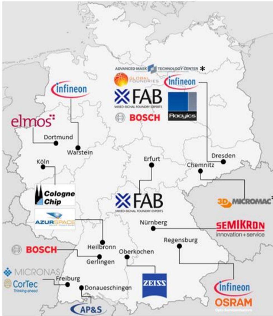
図 1 欧州共通利益に適合する重要プロジェクト(IPCEI)における電子産業に関するドイツ企業群