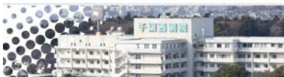
千葉西総合病院 408床