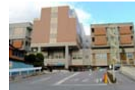
小諸厚生総合病院(320床)