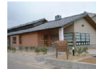
鳥屋診療所いきいき