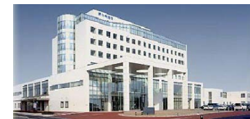
新行橋病院 246床 救急・災害