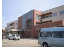
青山彩光苑 穴水ライフサポートセンター