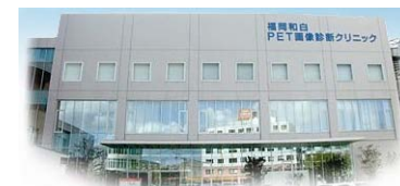
福岡和白PETCTクリニック