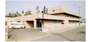
老人保健施設和光苑