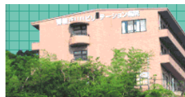
香椎丘リハビリテーション病院 120床