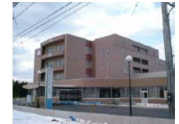
介護療養老人保健施設 恵寿鳩ヶ丘