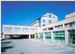
下伊那厚生病院(99床)