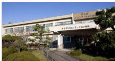
浜松市リハビリテーション病院180床