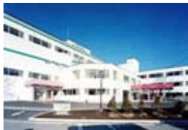
富士見高原病院(149床)