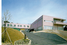
身体障害者更生・援護・授産施設 青山彩光苑