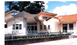
鹿島デイサービスセンター いこい(運営受託)