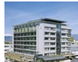
長野松代総合病院(365床)