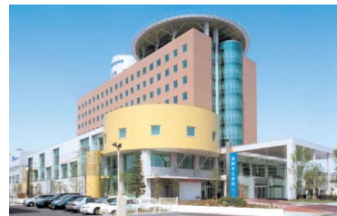
福岡和白病院 317床 心血管・脳神経・救急