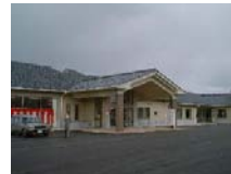
鳥屋在宅複合施設 ほのぼの(運営受託)