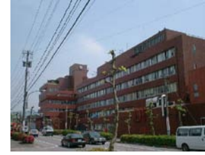
恵寿総合病院(451床) PET-CT・リニアックセンター