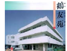
田鶴浜診療所 老人保健施設鶴友苑