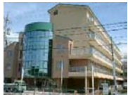
特別養護老人ホーム エレガントなぎの浦 ケアハウス アンジェリーなぎの浦