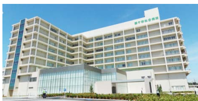
鎌ヶ谷総合病院 248床