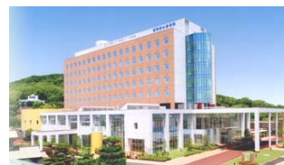
福岡新水巻病院 212床 周産期